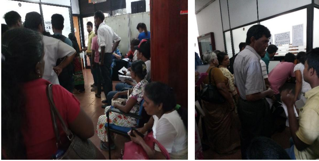
ஸ்ரீ ஜயவர்தனபுர கோட்டை பிரதேச செயலகத்தின் பதிவாளர் பிரிவு