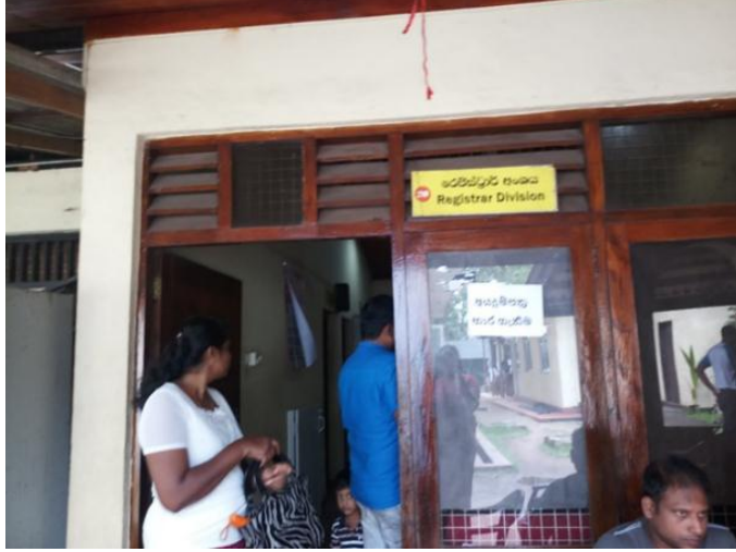
ஹோமாகம பிரதேச செயலகத்தின் பதிவாளர் பிரிவு