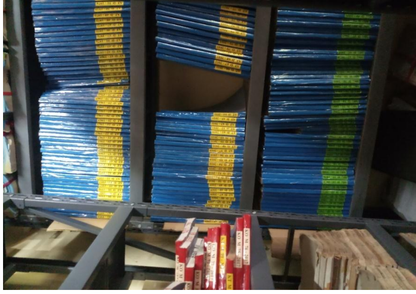
ஹோமாகம பிரதேச செயலகத்தின் பதிவேடுகள் அறை