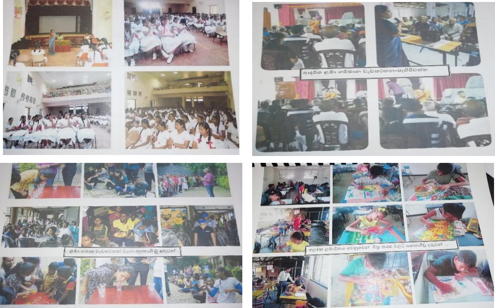
சிறுவர் மேம்பாட்டு உத்தியோகத்தரால் செயற்படுத்தப்பட்ட நிகழ்ச்சித்திட்டங்கள்

ஸ்ரீ ஜயவர்தனபுர கோட்டை பிரதேச செயலக பிரிவின் மேமா/ஐய/சிரிபரகும்பா வித்தியாலயத்தில் மிகக் குறைந்த கல்வியறிவினை கொண்ட சுமார் 25 பிள்ளைகளைக் கொண்ட குழுவுக்கு எந்தவொரு அரச அனுசரணையும் இல்லாமல் சிறுவர் மேம்பாட்டு உத்தியோகத்தரால் வளவாளர்களின் சேவைகளைப் பெற்று 2018 ஆம் ஆண்டில் மேலதிக வகுப்புகள் நடாத்தப்பட்டிருந்தன. அதன் மூலம் பிள்ளைகளின் கல்வியறிவு முன்னேற்றம் அடைந்துள்ளதாக உத்தியோகத்தரால் தெரிவிக்கப்பட்டது. தமது கடமையை மிகைத்து மிகவும் அர்ப்பணிப்புடனும் அக்கரையுடனும் இப் பிரதேச செயலகத்தில் சேவை புரியும் சிறுவர் மேம்பாட்டு உத்தியோகத்தர் சிறுவர் தலைமுறைக்காக செய்யப்படும் சேவை பாராட்டக்கூடிய சேவையொன்றாக இருப்பதுடன் ஏனைய பிரதேச செயலகங்களில் அவ்வாறான நிலைமையொன்று அவதானிக்கப்படவில்லை.