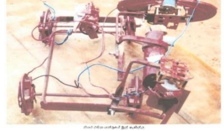
புல் வெட்டும் இயந்திரத்தின் ஆரம்பப் பகுதி