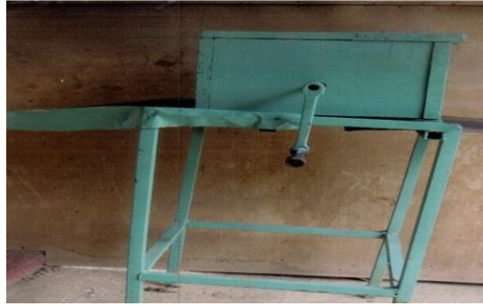
பாடசாலை புத்தாக்குனர்களின் கச்சான் வெட்டும் இயந்திரம்

(இ) புத்தாக்குனர்களுக்கு கடன் வசதிகளை வழங்குதல்