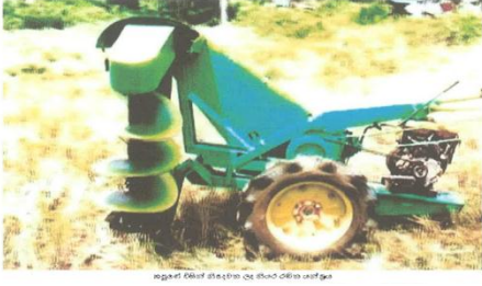
புல் வெட்டும் இயந்திரம்