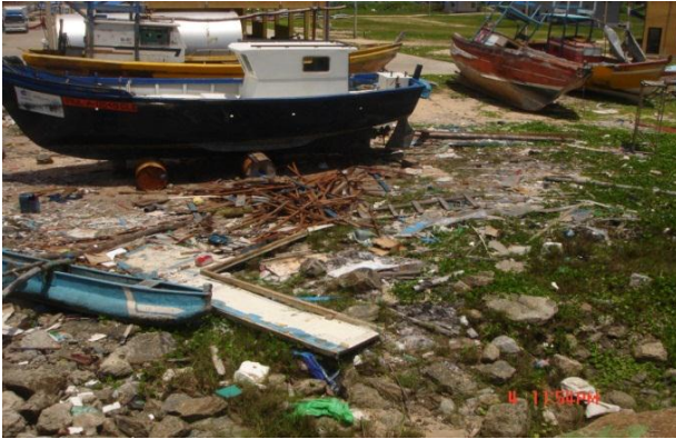
அசுத்தமடைந்துள்ள துறைமுகப் பிரதேசம்