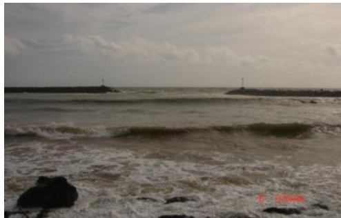
துறைமுக தடாகத்தினுள் கடல் அலைகள் எந்நேரமும் வந்து செல்லல்