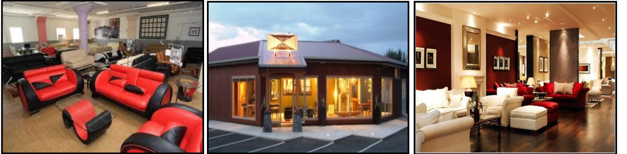
அரச மரக் கூட்டுத்தாபனத்தின் பதில்

அரச மரக் கூட்டுத்தாபனமானது புதிய கலைக் காட்சியறையினை நிர்மாணிப்பதற்கும் சுற்றுப்புற சுற்றாடலை உள்ளடக்கி தற்போதுள்ள காட்சியறைகளை தரமுயர்த்துவதற்கும் 2013 பாதீட்டில் நிதிகளை ஒதுக்கியுள்ளது. உற்பத்திப் பொருட்களதும் காட்சியறையினதும் அச்சிட்ட புகைப்படங்கள் சரியான சூழ்நிலையினையும் புகைப்பட பிடிப்பாளர்களின் புகைப்படங்களையும் சரியாக வெளிப்படுத்தவில்லை.